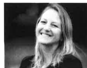
par Charlotte Uрман

Ce nouveau Règlement doit aussi être appréhendé par les entreprises comme une véritable opportunité puisque se pencher sur cette question de fond peut permettre de prendre conscience de la nécessaire sécurité